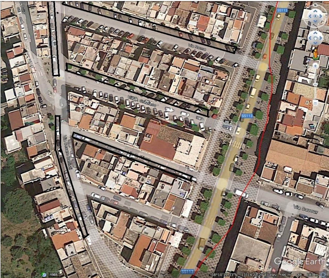
n.1: CENTRO URBANO – VIA C.BATTISTI, VIA SANT'ERASMO, VIA RIZZO, VIA O. GRAZIANO, VIA ROMA.

Procedura ad evidenza pubblica ai sensi dell'art.71 del d.lgs. 36/2023 per l'affidamento in via sperimentale della fornitura a noleggio di parcometri, installazione, attivazione, manutenzione e servizio di gestione e controllo dei parcheggi a pagamento del territorio comunale senza obbligo di custodia nel periodo dal 01.04.2025, e comunque dalla sottoscrizione del contratto, e fino al 30.09.2025, ai sensi dell'art. 50 lett. b) del D.Lgs. 31 marzo 2023, con il criterio dell'offerta economicamente più vantaggiosa sulla base del miglior rapporto qualità/prezzo. CIG: _____